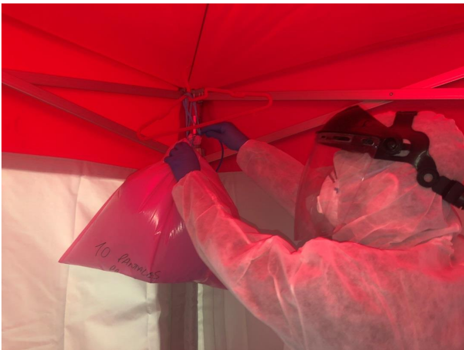
Introducción del tubo

Por favor, ante cualquier modificación de este protocolo, comunicarlo con anterioridad a través de las direcciones de correo facilitadas en este documento.