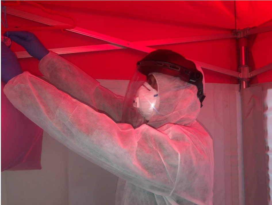
Persona con el EPI